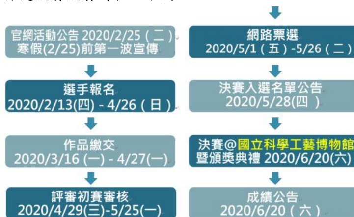
圖 2、2020 全國科學探究競賽競賽時程